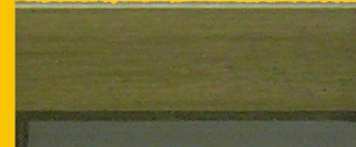
Szlifowany miedź (SM)