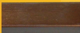
Szlifowany bursztyn (SB)